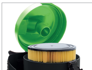
HEPA KARTUŠA (OPCIJSKO)