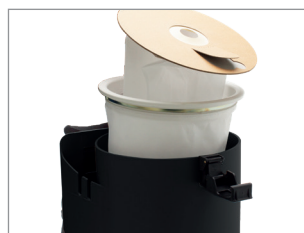
FILTRIRNA VREČKA IZ FLISA IN TEKSTILNI FILTER