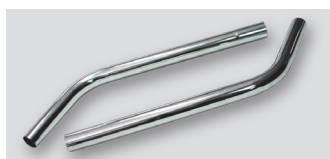
Cev dvojna trda, kriva, kromirana 00580