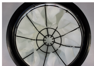
Glavni poliestrski POLY filter Art.06143