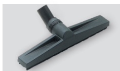
Šoba talna, trda, suha kriva kol. 400 06384