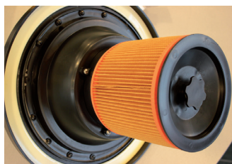
Polistrska POLY kartuša filter Art.2852 ali HEPA Art.2995