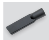
Ozki, široki nastavek 00003