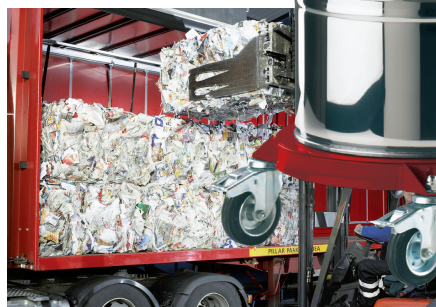
DEPONIJE IINRAVNANJE Z ODPADKI