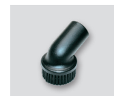
Čopasti nastavek 06295