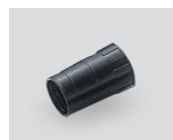
Reducirni adapter iz fi 38 na fi 36 06388