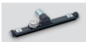
R7865 - Šoba za suho sesanje, trda, kovinska Ø 50 z zamenljivimi ščetinami