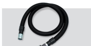
07433/60 COND - Cev antistatična Ø50 z manšeto - 3m