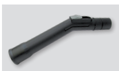
Ročaj Ø 38 06389