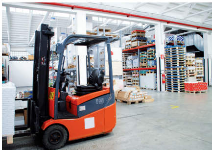
SPOŠNO SESANJE SKLADIŠČ IN PROIZVODNIH HAL