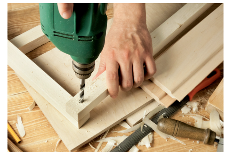
LESNO PREDLOVALNA INDUSTRIJA