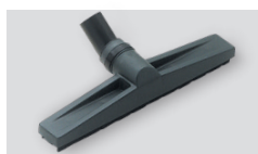
Šoba talna, trda, suha ali mokra kriva kol. 400 Ø 38 06384