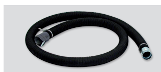
07619 - Cev gibljiva za sesanje olja Ø50 z manšeto - poljubna dolžina