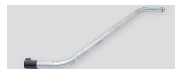
R7243 - Cev alu kriva Ø 50