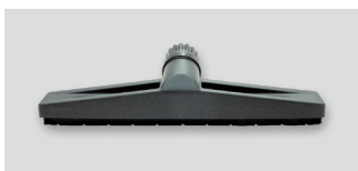
Šoba talna, trda, suha ali mokra ravna širine 40 cm Ø 38 03892 -