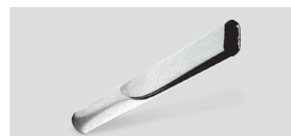
Nastavek ozki krom Ø 38 02296