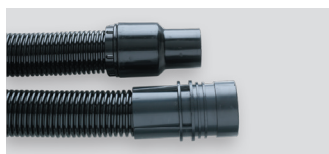
Cev EVA z manšetama - poljubna dolžina - Ø 38 02780