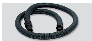
05057 - Cev gibljiva EVA Ø50 z manšetama - poljubna dolžina