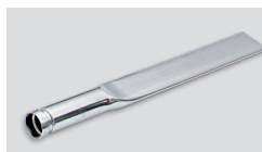
06866 - Nastavek ozki, kromirani Ø 50 - 30 ali 60 cm