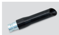
07260 - Nastavek okrogli z gumo Ø 50