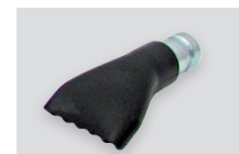
07259 - Nastavek široki z gumo Ø 50