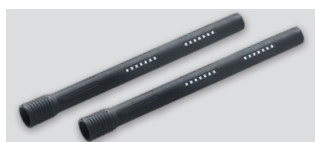
Trda aluminijasta PVC prevlečena cev 0,5 m Ø 38 06387