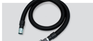
07433/60 COND - Cev antistatična Ø50 z manšeto - poljubna dolžina